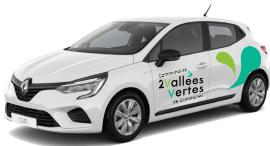
Décoration de véhicule