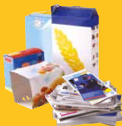
Papiers & emballages en carton