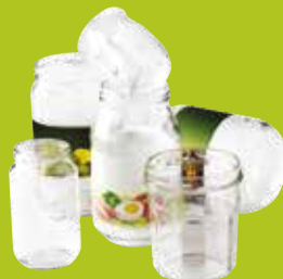
Pots & bocaux en verre