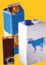
Briques en carton

EMBALLAGES EN PLASTIQUE, MÉTAL, PAPIER-CARTON