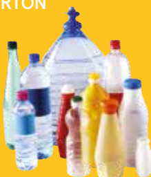
Bouteilles & flacons en plastique